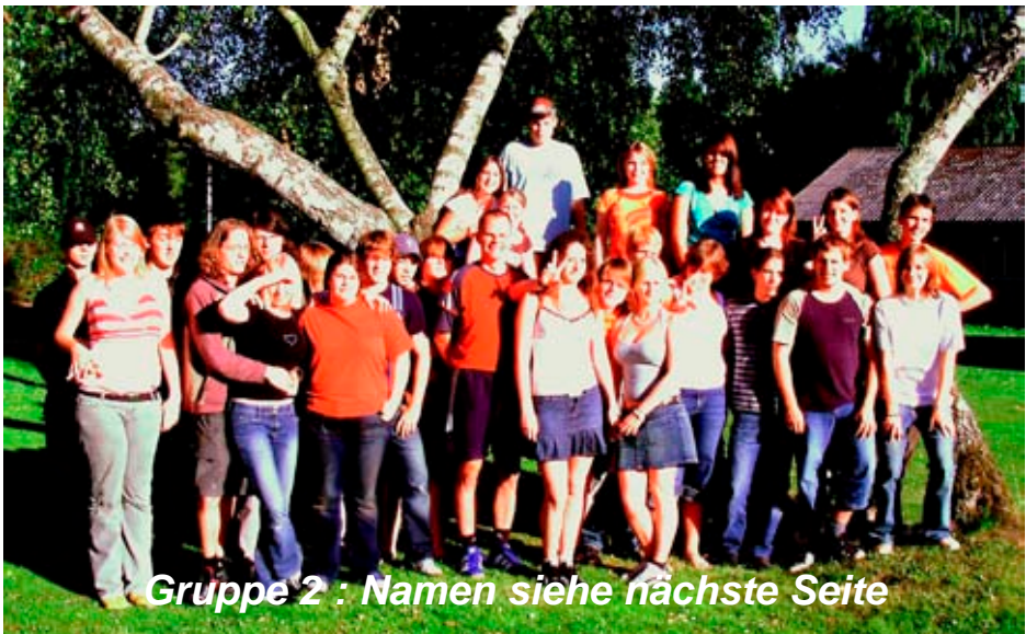
Gruppe 2 : Namen siehe nächste Seite