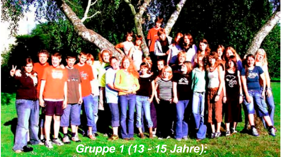
Gruppe 1 (13 - 15 Jahre):