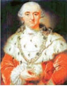
Kurfürst Karl Theodor 1763