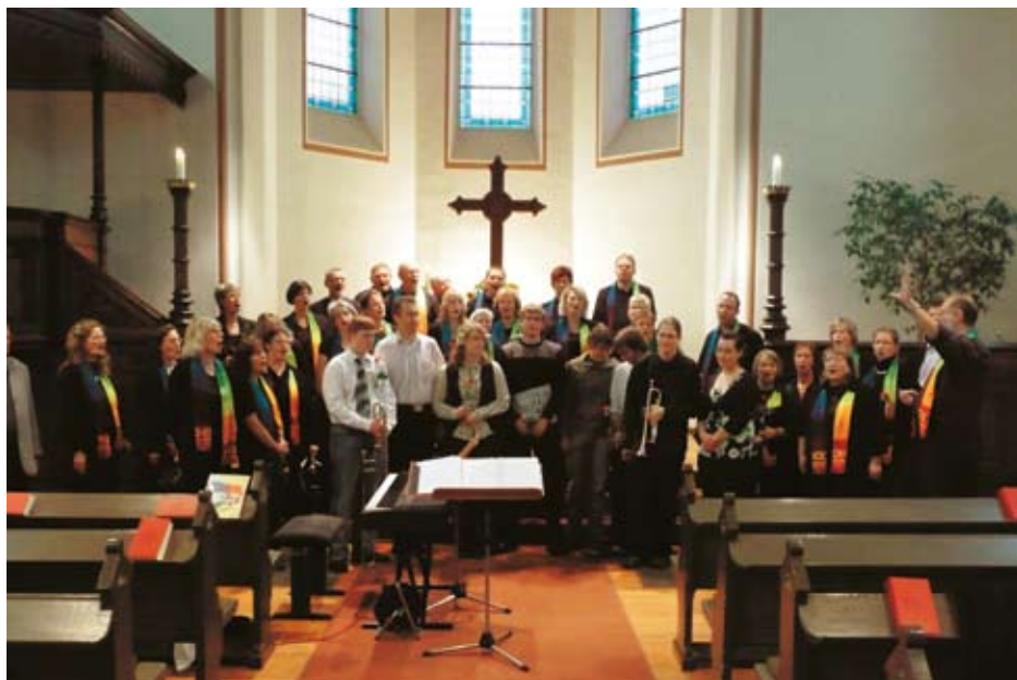
Radevormwalder Gospelchor und die Bläser des Laudate-Orchesters in der ev. Kirche in W-Beyenburg