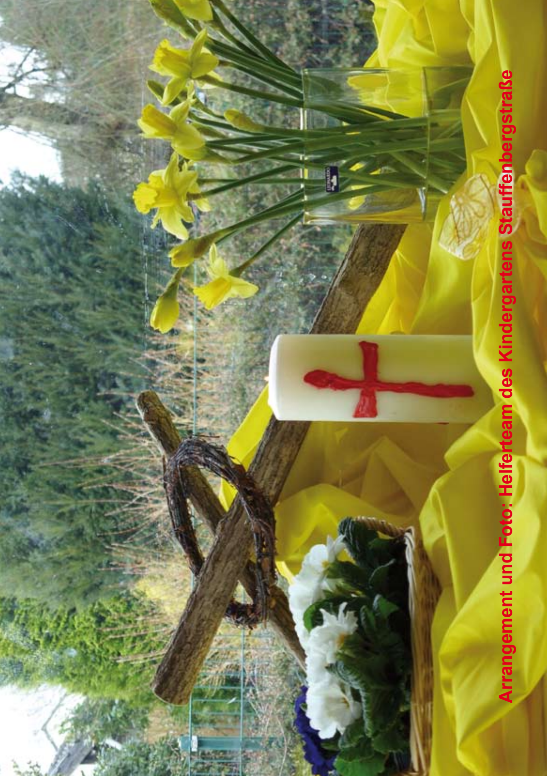
Arrangement und Foto: Helferteam des Kindergartens Stauffenbergstraße