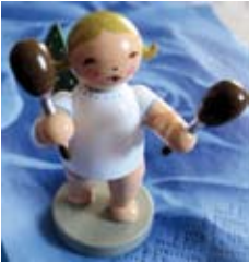
Ein Engel für Mittagstisch-Engel

Am Montag, 22. Dezember 2008 war es wieder einmal so weit: Den Mitarbeitenden des Ökumenischen Mittagstisches dankte das Presbyterium der Evangelisch-lutherischen Gemeinde für ihren Dienst. Während des „Weihnachtsfrühstücks“ überreichte Frau Weber den Damen einen Engel und den Herren eine Flasche Wein, zusammen mit einem Weihnachtsgruß. Damit soll allen Mitarbeitenden die Wertschätzung ausgedrückt werden für ihren unermüdlichen Einsatz. Sind sie es doch, die bedürftigen Menschen unserer Stadt einmal in der Woche ein warmes Mittagessen zubereiten und darüber hinaus Lebensmittelpakete weitergeben. Sach- und Geldspenden dafür kommen von vielen Bürgern Radevormwalds. „Neben der Verkündigung, der Feier des Sakramente und der Leitung ist Diakonie eine Wesens- und Lebensäußerung der Kirche“ (vergl. „Kirche Kompakt“). Ich denke, die Damen und Herren des Ökumenischen Mittagstisches lindern für viele Menschen alltägliche Sorge, werden ihnen zu Engeln.