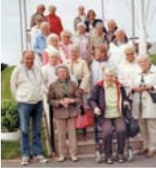
Freizeitgruppe an der Elbtterasse bei Otterndorf.