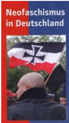
Ausstellung „Neofaschismus in Deutschland“ ab Samstag 11. September im Bürgerhaus

Der Runde Tisch gegen Rechts freut sich, den Bürgerinnen und Bürgern Radevormwalds im Rahmen seiner Öffentlichkeitsarbeit im September die wieder aktualisierte Ausstellung „Neofaschismus in Deutschland“ präsentieren zu können. Sie ist herausgegeben von Verdi Nord und dem Bund der Antifaschist/innen. Die Ausstellung, die in Radevormwald schon Tradition hat und früher vom DGB durchgeführt wurde, wird am Samstag, 11. September um 11.00 Uhr im Mehrzweckraum des Bürgerhauses eröffnet und kann während der Öffnungszeiten der Stadtbibliothek oder nach Vereinbarung bis Freitag, 24. September, 13.00 Uhr besucht werden. Der Eintritt ist kostenlos. Die Ausstellung ist insbesondere für Schulen, Kirchengemeinden, Parteien und Gewerkschaften geeignet, steht aber auch jedem interessierten Bürger offen. Führungen können ab sofort mit dem Sprecherrat vereinbart werden. Zudem wird ein kleines Beiprogramm angeboten werden. Über Ihren Besuch würden wir uns sehr freuen.