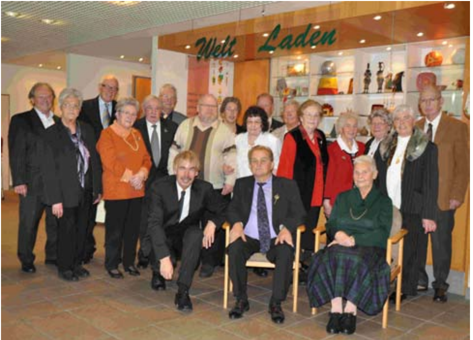
Gold- und Jubelkonfirmanden/innen am 7. November 2010 Silberkonfirmanden/innen am 5. November 2010