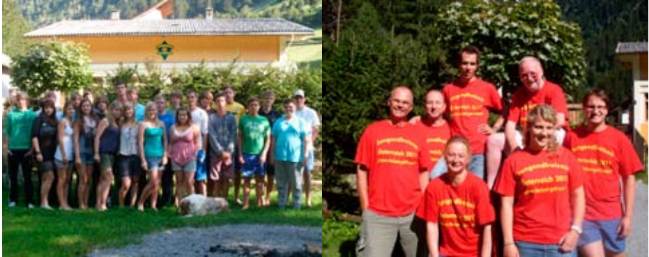
Die Teilnehmer und das Betreuerteam

Mit 24 Jugendlichen im Alter zwischen 16 und 19 Jahren sowie 6 Betreuern und einer Köchin reiste die Evangelische Jugend Rade vom 20. 8 bis 3. 9. ins Pitztal in Österreich.